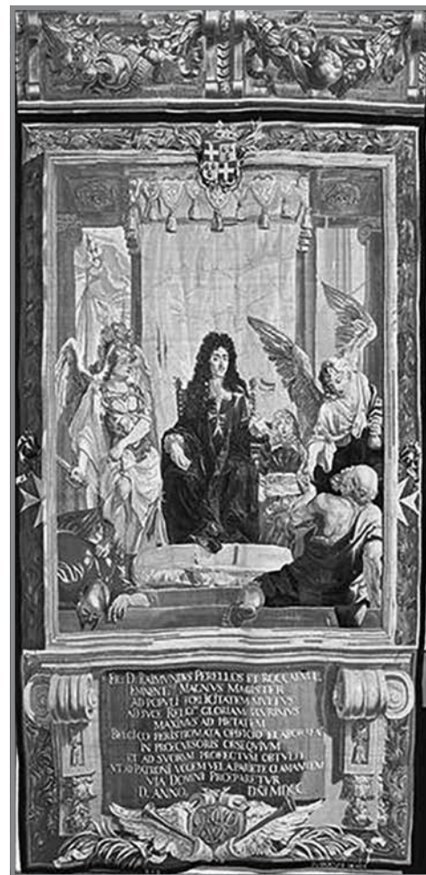
Il-Gran Mastru Perellos f'waħda mill-arazzi [ https://timesofmalta.com/article/the-magnificent-flemish-tapestries-arrival-in-malta-in-1702.933661 , aċċessat fit-28 ta' Lulju 2024]

Il-Gran Mastru Perellos huwa magħruf l-aktar għall-introduzzjoni tal-ligijiet merkantili li daħlu