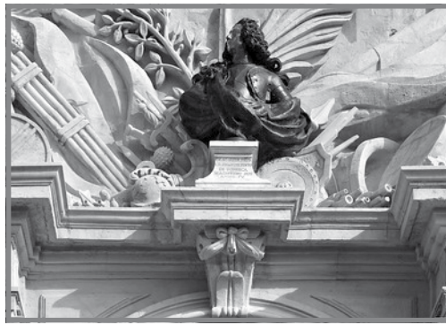
Il-bust ta' Pinto fuq il-bieb principali tal-Berġa ta' Kastilja

Huwa ta ismu lir-raħal ta' Ħal Qomi, Casal Pinto, u ffacċja kongura mill-ilsiera imma l-komplott kien inkixef qabel ma seħħ. Żgur u mhux