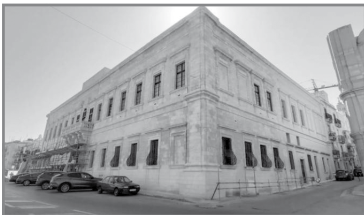
Il-Berġa tal-Baviera, il-palazz ta' Zondadari qabel sar Gran Mastru [ https://www.guidememalta.com/en/this-stunning-auberge-in-valletta-is-getting-a-much-needed-facelift-and-is-looking-fab , aċċessat fit-28 ta' Lulju 2024]

** Din kienet il-milizzja Maltija fi żmien il-Medju Evu u fi żmien il-ħakma tal-Ordni ta' San Ġwann.