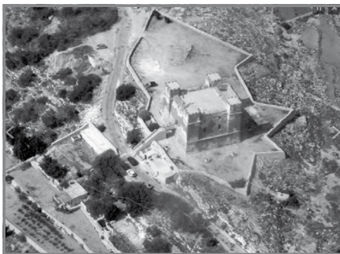
It-Torri l-Aħmar [ https://dinlartelwa.org/heritage-sites/managed-heritage-sites/st-agathas-tower-the-red-tower-Mellieħa/ aċċessat fit-28 ta' Lulju 2024]

Dan il-granmastru dam 21 sena jmessi lil Malta, li matulhom seħħu diversi riformi u anki ħafna taqlib. Dan it-taqlib kien ġej mill-inkwiet bejn Franza u Spanja li spiċċa fi gwerra. Dan it-taqbid holoq ħafna inkwiet fi hdan l-Ordni għax ħafna kavallieri kienu